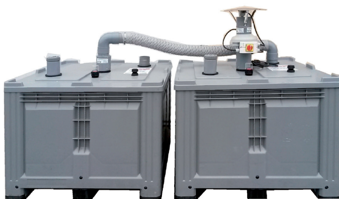
Kit composto da 2 moduli

CAPACITÀ DI EVAPORAZIONE MEDIA 7,25 LT/GIORNO